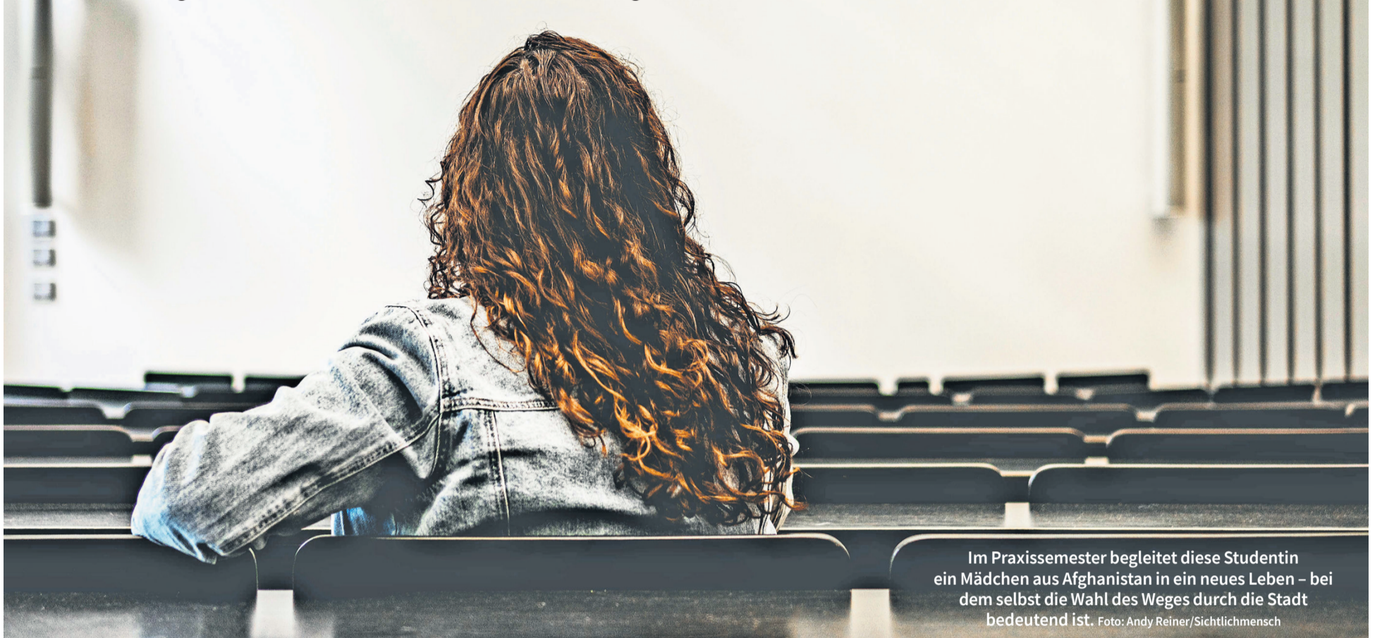
Im Praxissemester begleitet diese Studentin ein Mädchen aus Afghanistan in ein neues Leben – bei dem selbst die Wahl des Weges durch die Stadt bedeutend ist.

Studentinnen im Praxissemester Zwangsehen sind in Deutschland zum Glück nur selten, aber es gibt sie. Eine Studentin der Evangelischen Hochschule Ludwigsburg berichtet von einem Fall aus ihrem Praxissemester beim Wohnprojekt Rosa, der unter die Haut geht: Mala musste mit 14 Jahren die Steinigung ihrer Cousine in Afghanistan mitansehen. Als sich ihr 16. Geburtstag nähert beschließt das Mädchen zu fliehen.